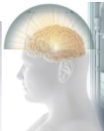
ホスレボドパ ホスカルビドパ水和物 持続皮下注射療法 CSCI