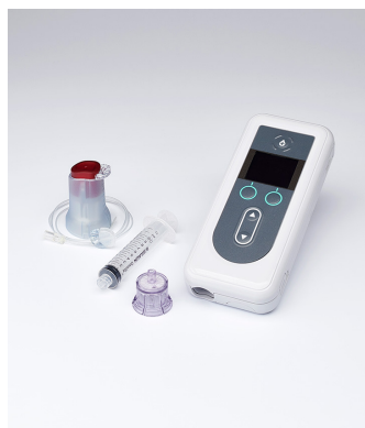
レボドパ・カルビドパ 経腸用液療法 LCIG